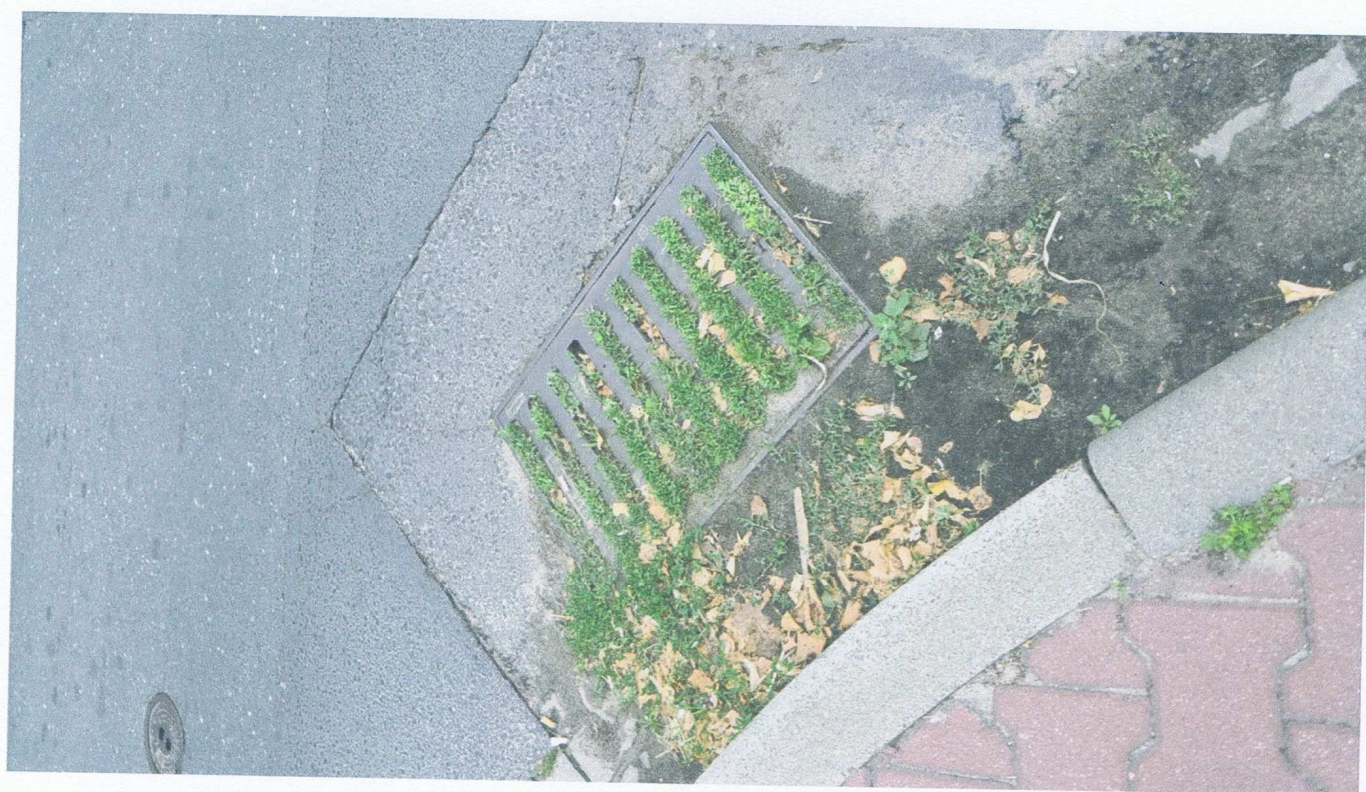
Fot.3. Kratka kanalizacji wód opadowych.