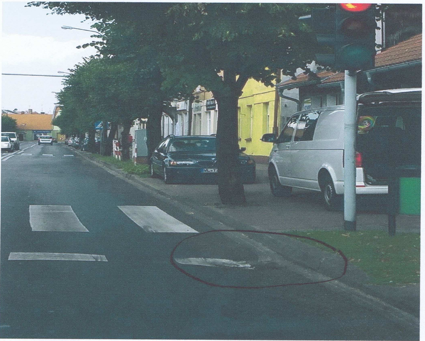
Fot. 4. Zapadnięcia kratki kanalizacji wód opadowych.