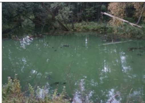
Zakwity glonów na Małej Wełnie pomiędzy jeziorem Budziszewskim oraz Rogoźno spowodowane nieustannym zasilaniem dużą ilością biogenów. Data: 09.10.2019 r Według uzyskanych opinii naukowców bez odciążenia dopływu zanieczyszczeń rekultywacja tych jezior będzie bezskuteczna.