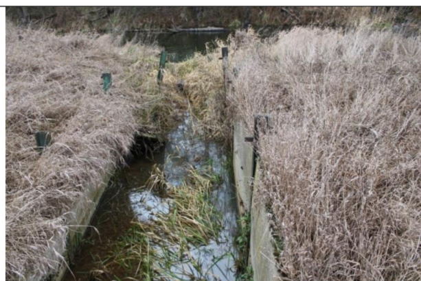
W Rogoźnie znajduje się wiele niezidentyfikowanych obiektów melioracyjnych, które wprowadzają zanieczyszczenia do rzeki Wełny. Przykładem jest poniższy obiekt znajdujący się bezpośrednio przy linii kolejowej Poznań-Piła - Data: 03.01.2020 rok.