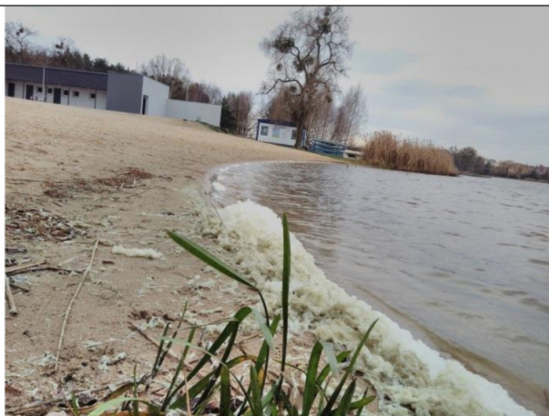
Jezioro Rogoźno Plaża „Ośrodek za Jeziorem” - 30.12.2019r