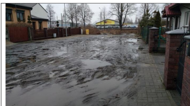
Ulica Różana w Rogoźnie czasie opadów

Ulica Różana w Rogoźnie czasie opadów - źródło: portal FB z 29.04.2020 r.