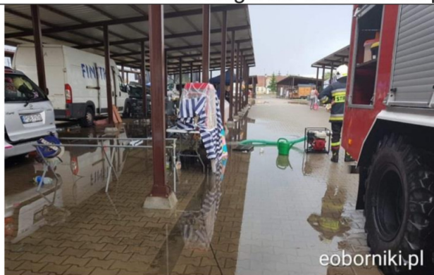
Interwencja OSP Budziszewko na targu w Rogoźnie po większych opadach deszczu w 2019 roku