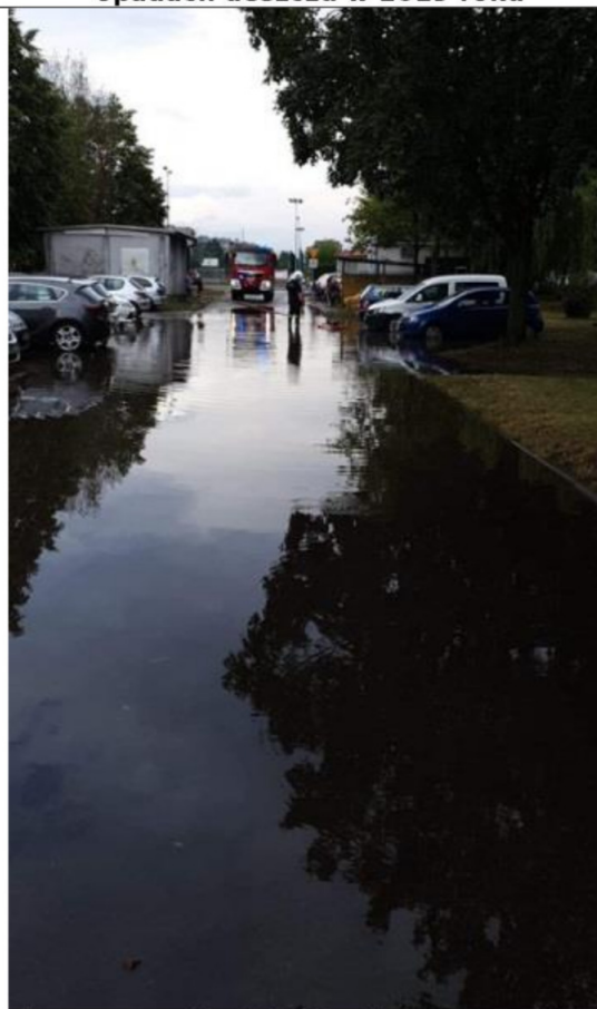
Interwencja OSP Parkowo na ulicy Biskupskiego w Rogoźnie po większych opadach deszczu 2019 r