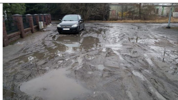
Ulica Różana w Rogoźnie czasie opadów

Należy tu podkreślić, że informacje, o które zwraca się Stowarzyszenie są to dane publiczne, do których prawo wglądu ma każdy obywatel Rzeczypospolitej Polskiej, niezależnie od samorządowych sympatii. W uzasadnieniu wniosku możemy przeczytać, że zgodnie z art. 8 ust. 1 Ustawy z dnia 3 października 2008 r. o udostępnianiu informacji o środowisku i jego ochronie, udziale społeczeństwa w ochronie środowiska oraz o ocenach oddziaływania na środowisko „Władze publiczne są obowiązane do udostępniania każdemu informacji o środowisku i jego