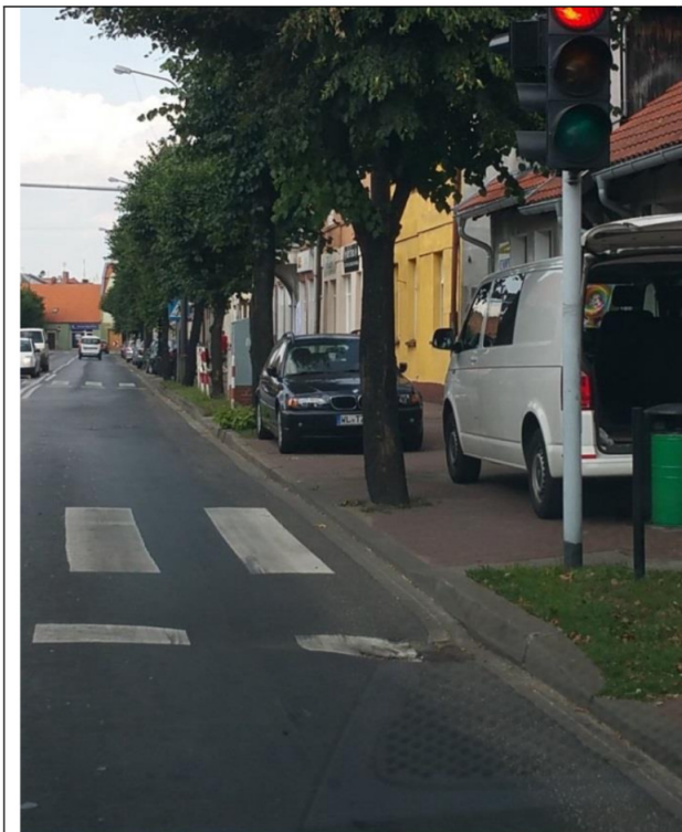
Zapadnięcia kraterów kanalizacji wód opadowych w Rogoźnie ul. Wielka Poznańska - 30.07.2019r.

Poniżej na zdjęciu jest przykład zapadniętej kratki kanalizacji wód opadowych w centrum Rogoźna ul. Wielka Poznańska - 30.07.2019r.