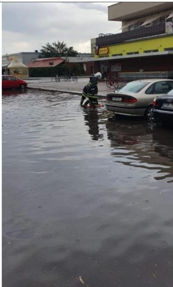
Interwencja OSP Parkowo na osiedlu Przemysława w Rogoźnie po większych opadach deszczu w 2019 r