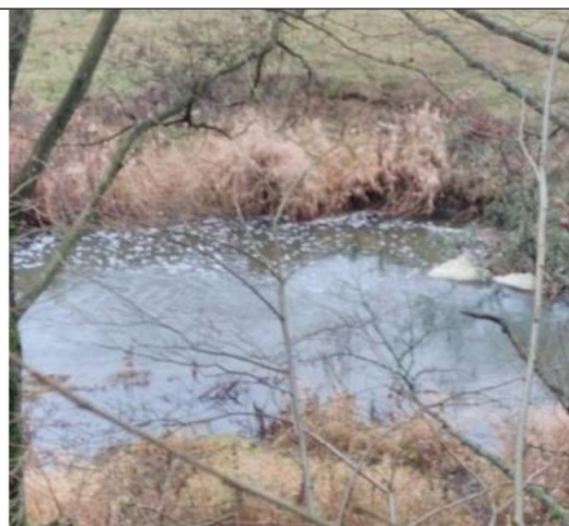
Rzeka Wełna - Przy szpitalu Rehabilitacyjno-Kardiologicznym 3 km przed ujściem wody w Kowanówku k. Obornik - 08.12.2019 r