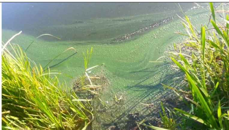
Zakwity sinicowe na jeziorze Rogoźno w trakcie prowadzonej rekultywacji 22.09.2019 r.