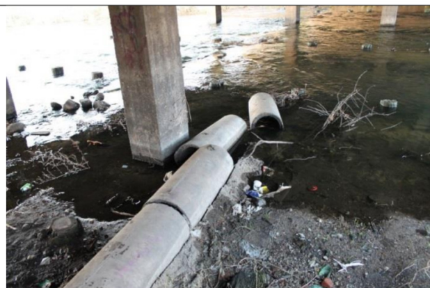
Rogoźno - pod mostem na ulicy Lipowej - 02.01.2020 r.