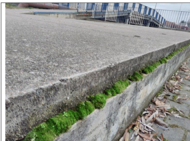
Pokrywa piaskownika przy ujściu Jeziora Rogoźno do rzeki Wełny jest zarosnięta mchem. Stowarzyszenie Jezioro Rogozińskie prosi o udostępnienie dokumentacji dotyczących eksploatacji tego piaskownika oraz informacji wskazującej na sposób wykorzystania piaskownika dla ochrony środowiska. Data: 30.12.2019 r.