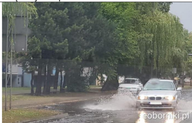
Rogoźno ulica Kościuszki po większych opadach deszczu w 2019 roku