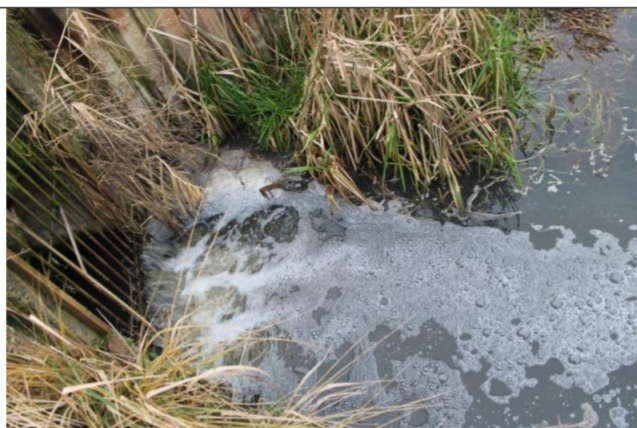
Wylot z oczyszczalni ścieków w Rogoźnie - 03.01.2020 rok - wygląd wypływającej cieczy, piana na wodzie oraz intensywny zapach moczu wskazuje, że w tym miejscu do rzeki Wełny przedostaje się nieustannie duża ilość zanieczyszczeń.

Poniższe zdjęcia prezentują niektóre z wielu niezidentyfikowanych i nieoznakowanych obiektów melioracyjnych w Rogoźnie, które wprowadzają zanieczyszczenia do rzeki Wełny. Należy także nadmienić, że wylot z oczyszczalni ścieków w Rogoźnie, w której wygląd wypływającej cieczy, piana na wodzie oraz intensywny zapach moczu wskazują, że w tym miejscu do rzeki Wełny przedostaje się nieustannie duża ilość zanieczyszczeń.