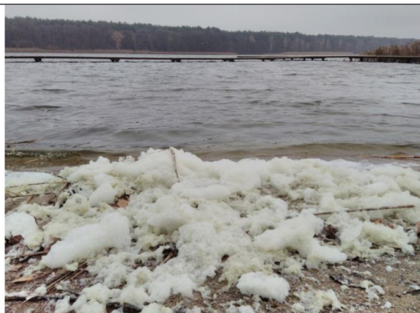
Jezioro Rogoźno - Plaża od strony miasta - 23.11.2019r

Prawidłowe funkcjonowanie kanalizacji ma znaczący wpływ na stan Jeziora Rogoźno oraz rzeki Wełny.