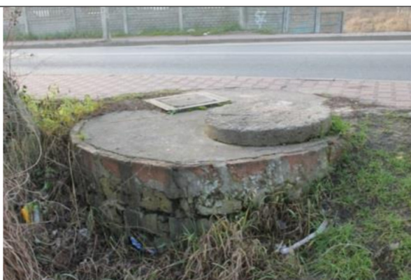
Nieoznakowany obiekt melioracyjny w Rogoźnie na ulicy Lipowej - 02.01.2020r.