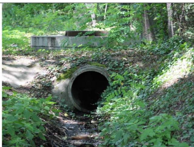
Ujście separatora do Jeziora Rogoźno 03.08.2019r. SJR prosi o udostępnienie pozwoleń wodnoprawnych na odprowadzanie wód opadowych z ulic i placów do Jeziora Rogoźno a także dokumentacji eksploatacyjnej potwierdzającej dotychczasowe inspekcje i czyszczenie separatorów.