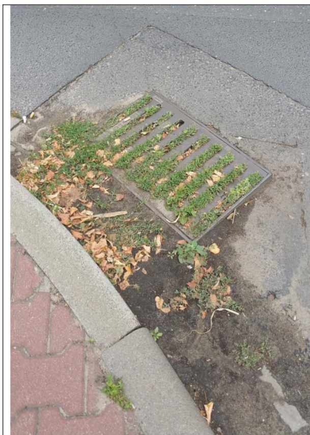
Zatkana kratka kanalizacji deszczowej w samym centrum Rogoźna - 2019.08.01

Wiele kraterów kanalizacji deszczowej w Rogoźnie, nawet w samym centrum, zasypanych jest piaskiem, zatkanych i zarośniętych trawą. Przykładem jest poniższe zdjęcie tej samej kratki wykonane w odstępie prawie roku czasu (01.08.2019r. oraz 06.05.2020r.). Pomimo zgłoszenia tej sprawy do UM Rogoźno w oficjalnym wniosku, sytuacja po prawie roku czasu nie uległa poprawie.