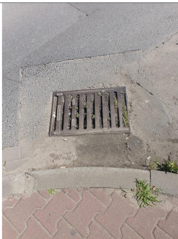
Ta sama kratka kanalizacji deszczowej w samym centrum Rogoźna. Przez prawie rok czasu nie nastąpiła poprawa (studzienka jest nadal zasypana piaskiem, zatkana i zarośnięta trawą) pomimo tego, że UM Rogoźna otrzymała oficjalne pismo w tej sprawie. Zdjęcie wykonano 6 maja 2020r