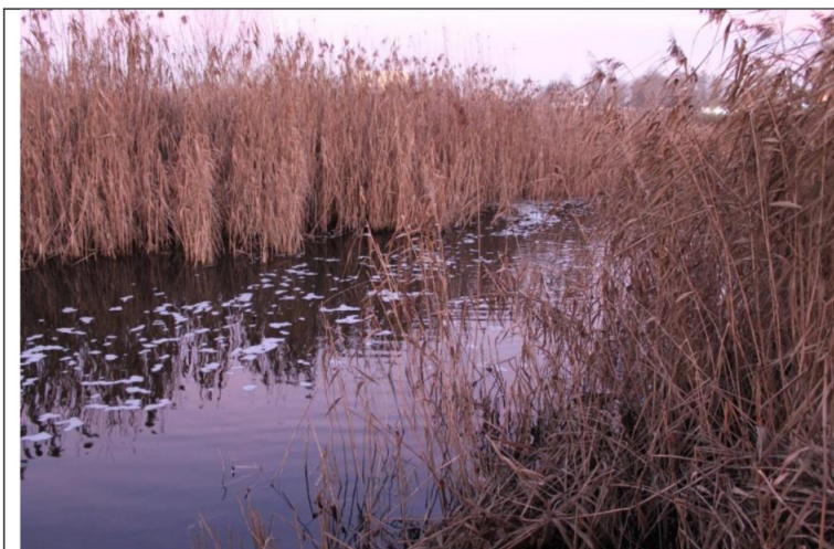
Rzeka Mała Wełna za ujściem jeziora Rogoźno przed wpłynięciem do rzeki Wełny - 02.01.2020 r. W rzece występuje silne zmętnienie, szarzielony kolor wody, gnilny zapach, kożuchy glonów, pojawiają się zakwity sinicowe oraz piana na powierzchni.